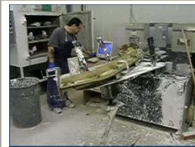
Fabrication de platres