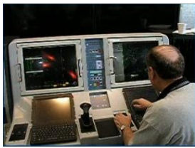
Console de bord