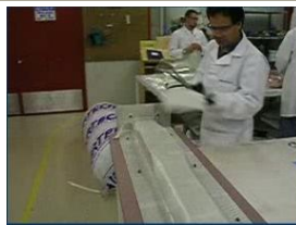
Fabrication de moules