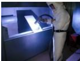
Projection au plasma