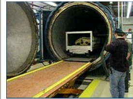
Cuisson en autoclave