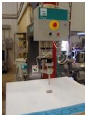
Découpe au jet d'eau