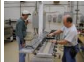
Injection de résine (RTM)