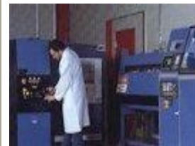
Découpe au laser