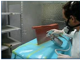
Peinture / Vernissage