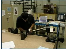
Équipement de mesures tridimensionnelles