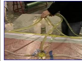
Injection de résine (RTM)