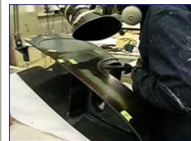
Robot - 6 axes